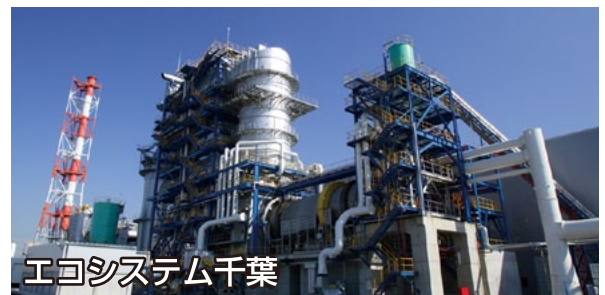
エコシステム千葉