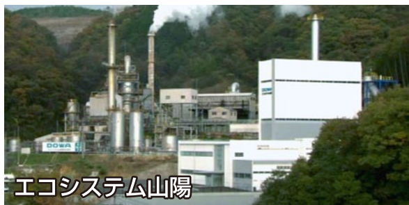
エコシステム山陽